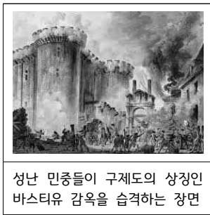
성난 민중들이 구제도의 상징인 바스티유 감옥을 습격하는 장면

[T유형] 다음 카드뉴스에서 (가) 카드에 들어갈 부연 설명으로 옳은 것은? [2점]