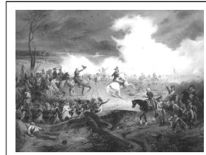
프랑스군이 발미에서 반혁명파인 프로이센을 격파하는 장면